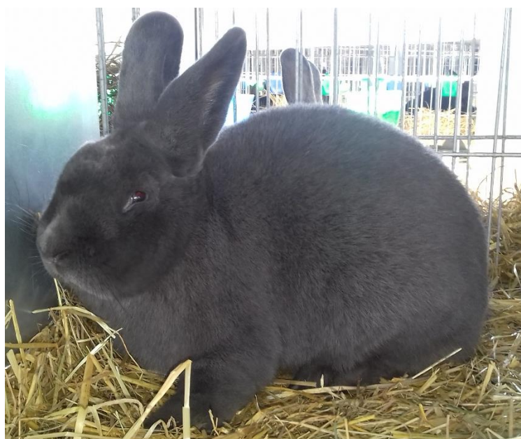
1.0 vídeňský modrý oceněný 96 b. – chovatel př. Starý Pavel