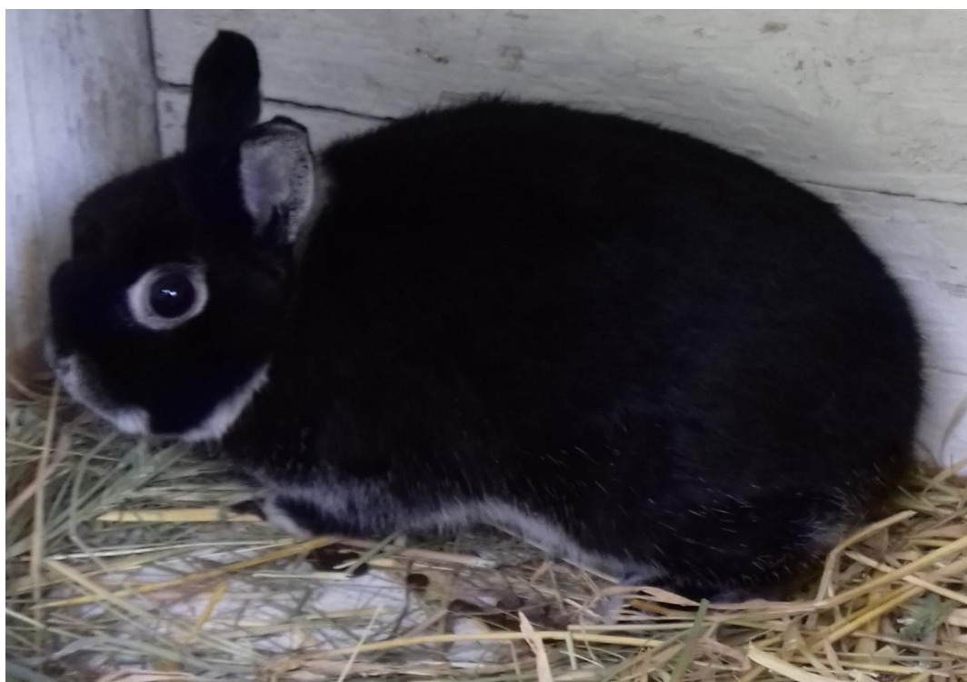
zakrslý bílopesíkatý černý oceněný 95 b. – chovatel Kašpar Ladislav