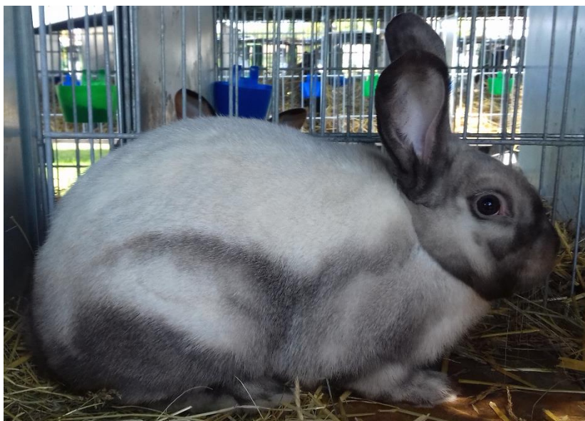
sallander př. Zemana Miroslava oceněný 95,5 b.