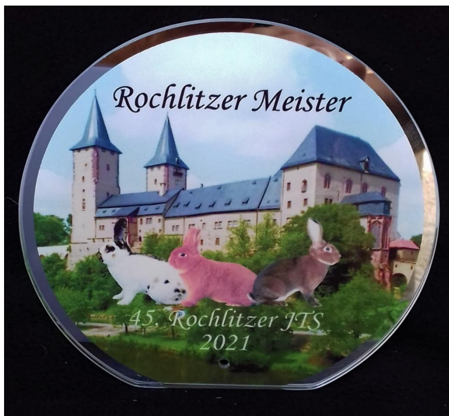
věcná cena (plaketa) pro mistry