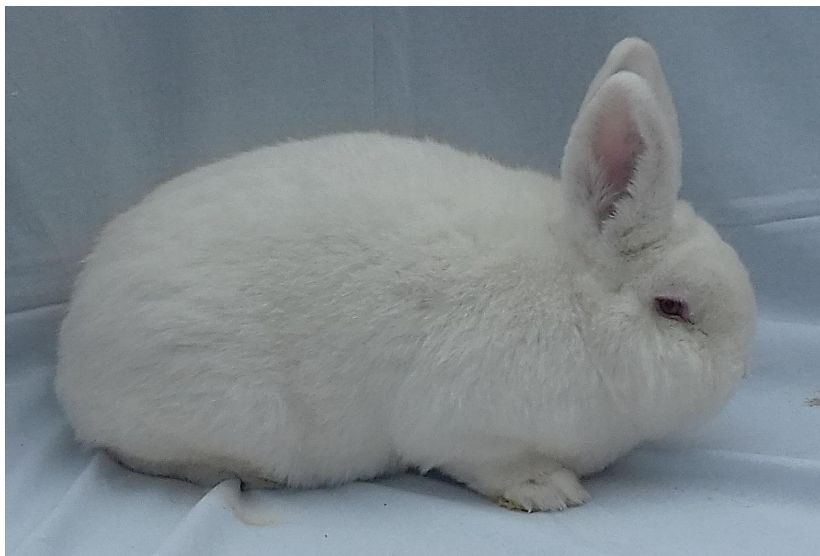
novozélandský bílý oceněný 95 b. – chovatel př. Kašpar Ladislav