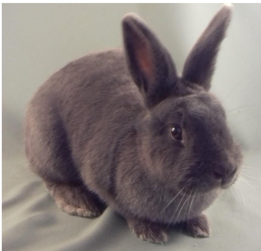
holičský modrý oceněný 96 b. – chovatel Zykl Dušan Bc.