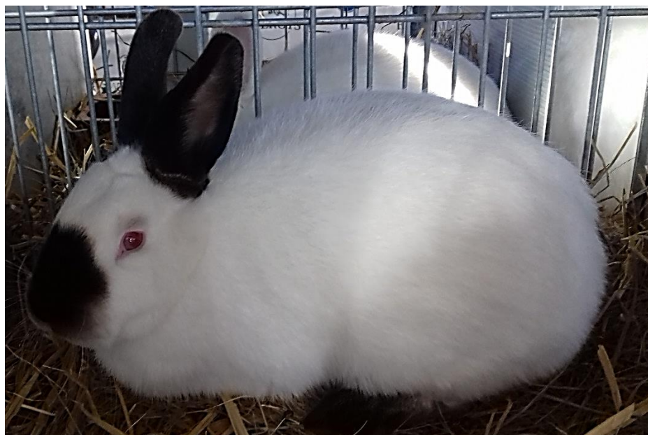
Kalifornský černý oceněný 95,5 b. z vítězné kolekce pro MCH – chovatel Vaněk Jiří