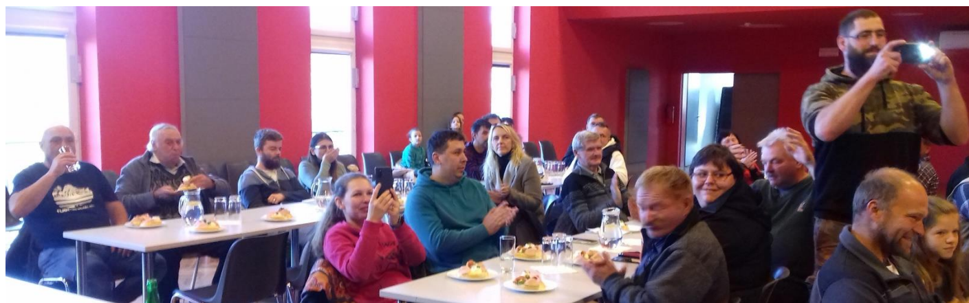
o slavnostní vyhlášení výsledků a předání pohárů byl mezi chovateli zájem.