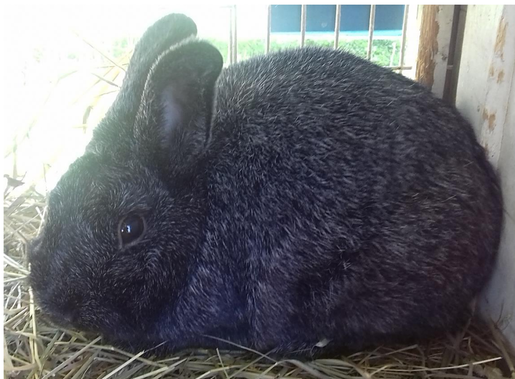
stříbřitý malý černý, člen vítězné kolekce, oceněný 95,5 b. – chovatel Cik Jiří